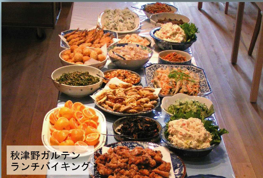
秋津野ガルテン ランチバイキング