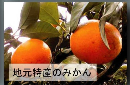
地元特産のみかん