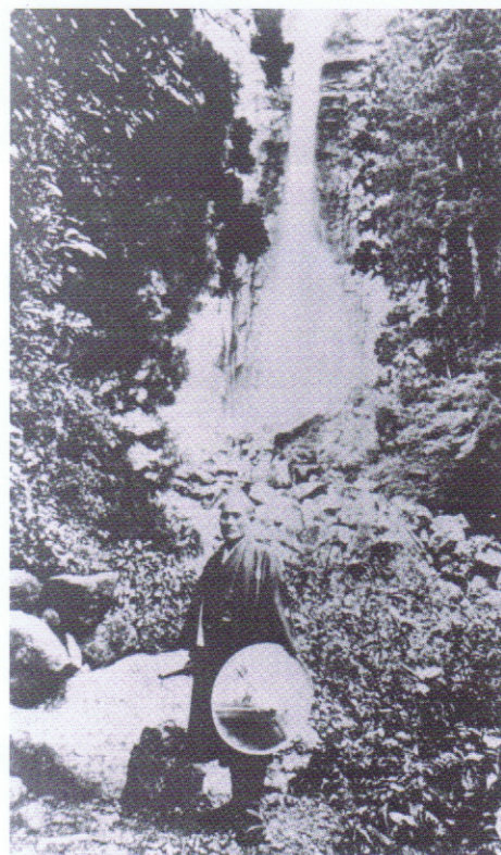
那智の滝の前に立つ開祖(大正14年頃 42歳頃) Morihei Ueshiba (~42 years old) in front of the Nachi-no-Otaki waterfall. (~1925)

〒646-0031和歌山県田辺市湊1619-8田辺市民総合センタースポーツ振興課内 日本語 HP http://www.tb-kumano.jp/aikido English HP http://www.tb-kumano.jp/en/aikido